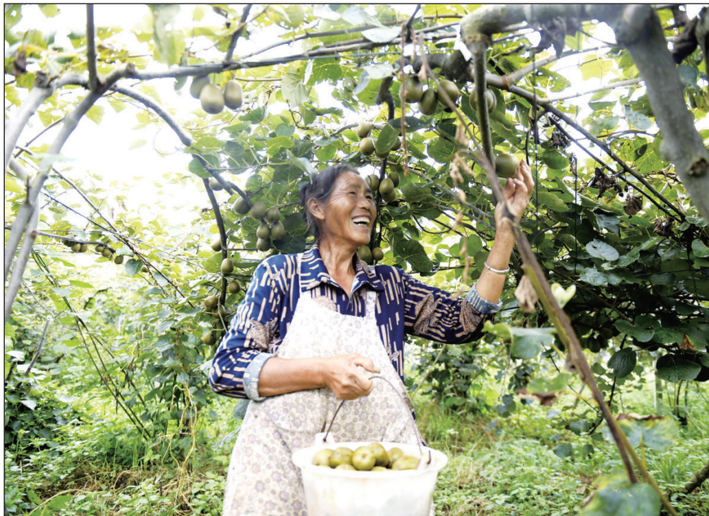
目前,贵州省黔南布依族苗族自治州安龙县钱相街道红心猕猴桃种植基地硕果累累,村民们忙着采摘供应市场。近年来,安龙县钱相街道积极调整农业产业结构,引进企业发展以猕猴桃种植为特色的生态农业,助力农民增收、农民增收。

不仅如此,四川省生态环境厅还将在全省范围内开展群众生态环境满意度调查测评工作,采取问卷调查和电话调查相结合的方式,对全省21个市(州)组织开展兼顾城乡居民和不同年龄段的群众生态环境满意度调查测评,调查结果将作为四川生态环境保护工作的重要依据。