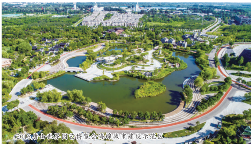
2016唐山世界园艺博览会海绵城市建设示范区