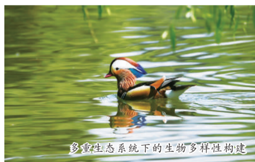
多重生态系统下的生物多样性构建

正和生态今日正式登陆上海证券交易所主板,首次公开发行新股4071.11万股,发行价为15.13元/股,募集资金总额61595.9109万元。