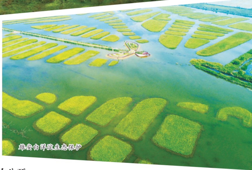
雄安白洋淀生态保护