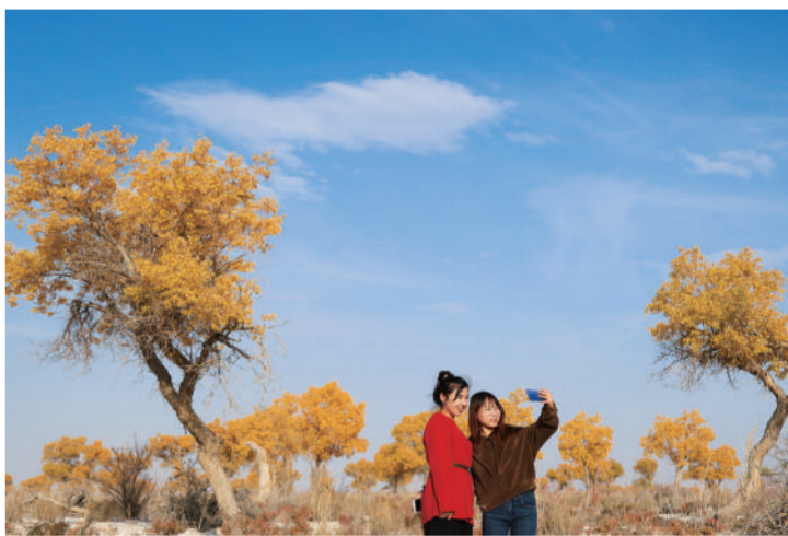
金秋,新疆维吾尔自治区巴音郭楞蒙古自治州博湖县境内的博斯腾湖乡阔音呼都克村的胡杨林进入最佳观赏季,吸引游客前来观光旅游。 年磊

新举措,收集员每天上门收集垃圾时根据居民分类正确率进行评分,并上传智慧环卫平台系统,居民可用累积分兑换礼品。 为实现垃圾从投放到处理全程不落地,高而办事处撤消了村内的大型(240L)垃圾桶,收集员利用垃圾分类收集车定时上门收集,实现垃圾从出门到进入最终处置环节全程不落地,不仅大大减少了蚊蝇孳生的可能性,也净化了村庄环境。 对于分拣出的可腐烂垃圾,高而办事处在辖区内建设17座太阳能阳光堆肥房进行堆肥。根据各村实际情况因地制宜,采取“一村一建”或“多村合建”方式,建设阳光堆肥房。垃圾堆肥后被免费发放给村民制作有机肥或直接还田增肥。 如今在高而办事处东沟村,每家每户门口的垃圾桶不见了。原有的垃圾分类亭也提升改造为垃圾分类宣传亭,村庄的面貌焕然一新。 季英德 黄永山