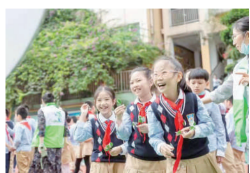
▲ 重庆中华路小学开展无废校园互动体验活动。

而在“无废校园”建设中,重庆也将进一步探索标准化模式,促进校园精细化管理和特色打造,将“无废意识”融入校园管理,把“无废文化”融入校园文化,推动“无废理念”入脑入心。