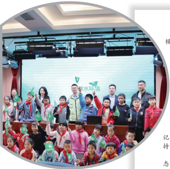
11月5日,上海市青浦区生态环境局志愿者宣讲团走进淀山湖小学开展保护水环境宣讲活动。