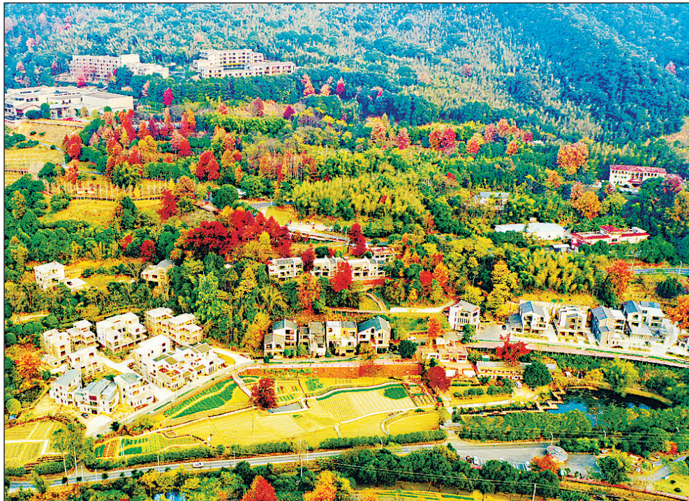
近年来，江西省赣州市大余县牢固树立“绿水青山就是金山银山”理念，遵循“不拆房、不毁林、不破路”的保护性开发原则，把大龙山村整体改造成生态休闲旅游地，不仅环境更好了，旅游产业还带动乡村振兴，助力村民致富。

为坚决做到“两个维护”的思想自觉、政治自觉、行动自觉，切实承担起生态环境保护的政治责任，协同推进美丽浙江系统性重塑，落实落细省共建共同富裕示范区合作协议，丰富拓宽“两山”转化通道，勇当生态文明先行示范排头兵。在学习研讨中，大家纷纷表示，要把学习贯彻党的十九届六中全会和省委十四届十次全会精神结合起来，把学习成果体现在行动上、落实到工作中，不断筑牢浙江高质量发展建设共同富裕示范区的生态基础，持续擦亮争创社会主义现代化先行省的生态底色。