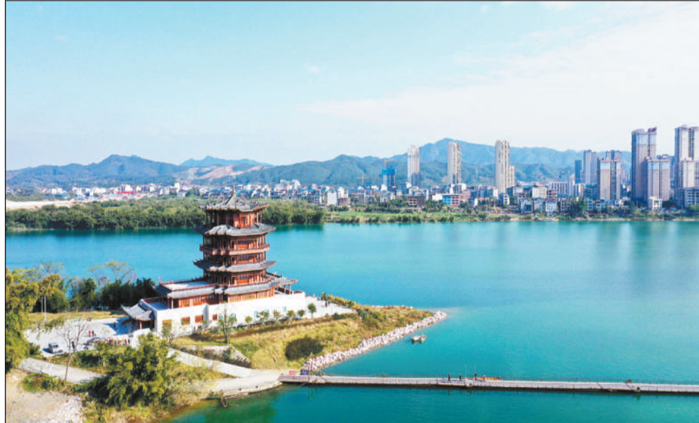
近年来,广西壮族自治区柳州市融安县始终坚持绿色发展理念,不断加快绿色发展步伐,区域生态环境质量持续向好。图为融江融安县城段的秀丽风光。