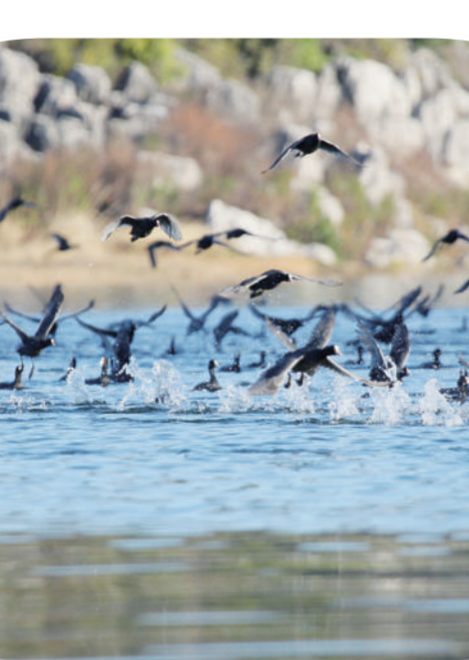
近年来云南省曲靖市沾益区海峰湿地生态环境和湿地内生态系统得到不断改善,吸引候鸟来此栖息。

《湿地保护法》第二条规定,湿地是指具有显著生态功能的自然或者人工的、常年或者季节性积水地带、水域,包括低潮时水深不超过6米的海域,但排除了水田、用于养殖的