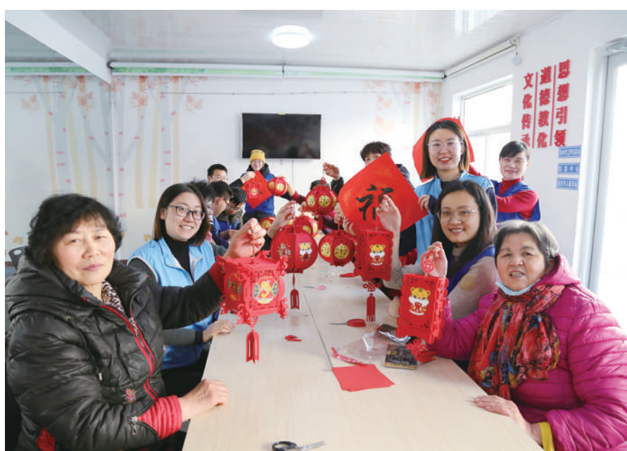
山东省威海市生态环境局新时代文明实践生态环境保护志愿服务队日前来到“双报到”社区鲸园街道花园社区,开展“绿色环保新风尚,健康文明过大年”主题志愿服务活动,在弘扬中华民族传统文化的同时,传递生态文明、绿色生活理念,推动构建生态环境治理全民行动体系。