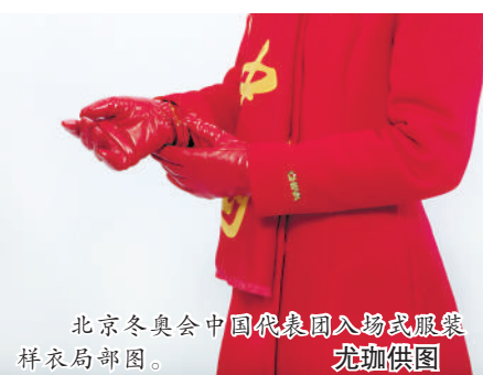
北京冬奥会中国代表团入场礼服服装样衣局部图。

平常我们巡护时检查红外相机,有可能刚架完相机几分钟,老虎就出现在监控画面里,这样的事情经常发生,有的时候还能听到虎啸的声音,非常震撼。