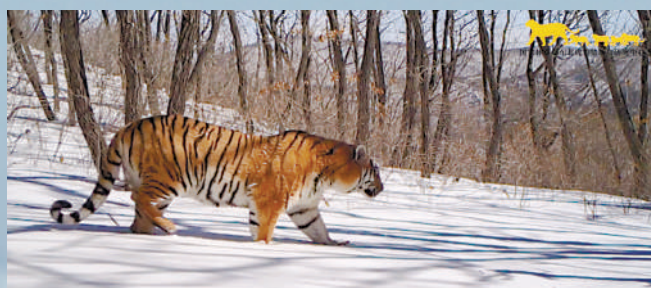
2020年3月在东北虎豹国家公园监测拍摄到的野生东北虎。

如今,这位北京师范大学的副教授,已成为国家林草局东北虎豹监测与研究中心主任副主任。2005年科考至今,他不仅见证了东北虎豹国家公园的建立,也见证了东北虎豹等野生动物生存境况的好转。