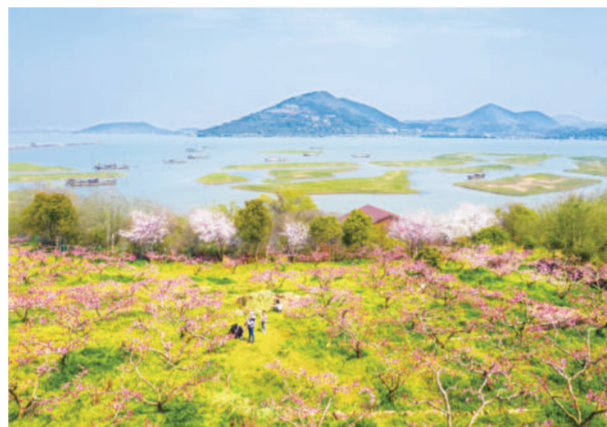
《春到太湖》

此外,江苏还从污染物排放限值限量、水污染物平衡核算、地方环境标准提升上抓源头治理,出台全省工业园区污染物排放限值限量管理方案,在172家省级以上园区开展环境质量和排放总量“双管控”,并全面加强园区监测监控能力建设,努力实现精准计量。对“低值减量”的,将排放指标统筹用于园区新上优质项目,既增加约束,更强调激励。开展全省城镇水污染物平衡核算管理,彻底摸清污水收集处理能力的底数。编制首个省域“十四五”生态环境基础设施规划建设规划,初步安排九大类671项重点工程,大幅提升“减污扩容”能力。正在制订和已发布的地方环境标准已达101项,发布数量是过去10年总和的两倍。