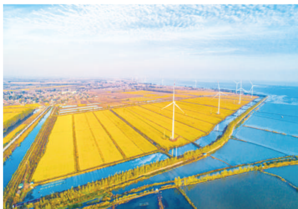
《湖岸风景线》 张笑摄于宿迁