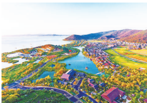
《生态秀美的拈花湾》 俞雪华摄于无锡