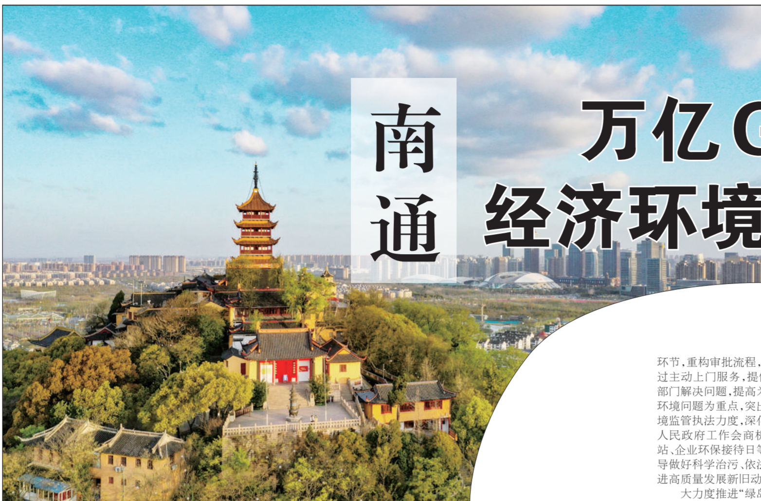
南通市狼山风景区