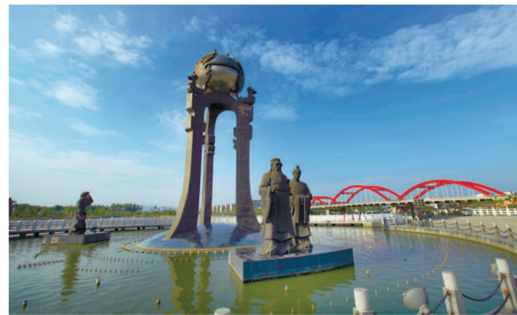
图为蓝天下泗水县圣源湖景区一隅。刘凯摄

金乡县发改、生态环境、公安、住建等各部门密切协作,重点围绕煤矿煤场、商品混凝土、移动源、在建工地等强化管控措施,确保减排到位,全力保障青山常在、绿水常流、空气常新。 刘凯