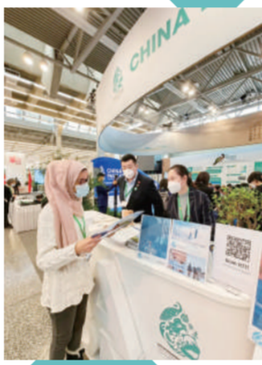
“上海日”活动当天,国外观众到展台参观了解上海展览内容。