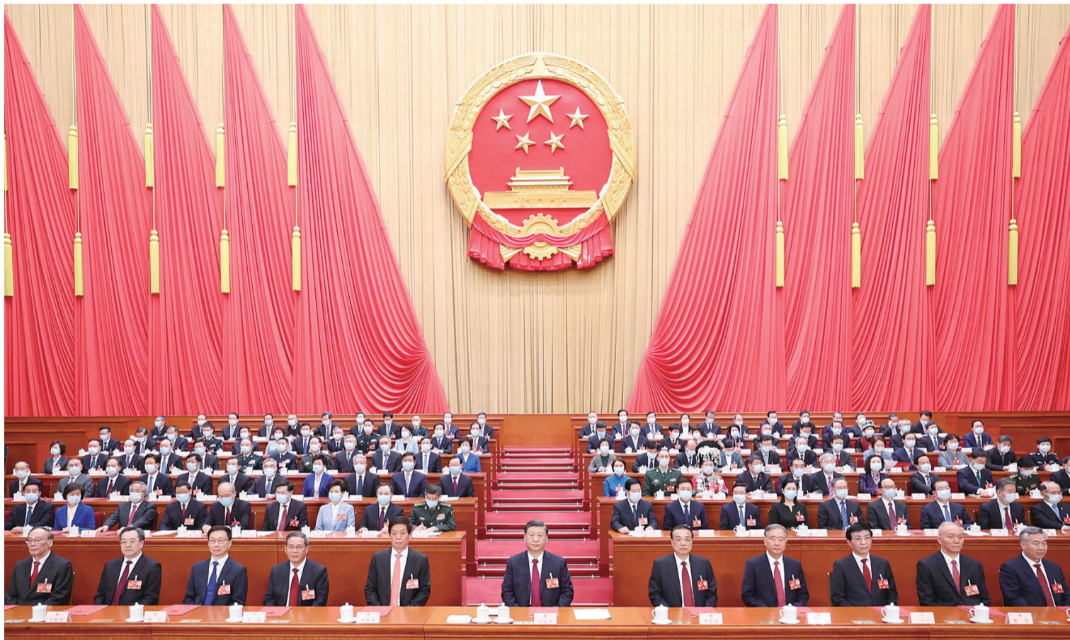
3月13日,第十四届全国人民代表大会第一次会议在北京人民大会堂闭幕。中共中央总书记、国家主席、中央军委主席习近平发表重要讲话。