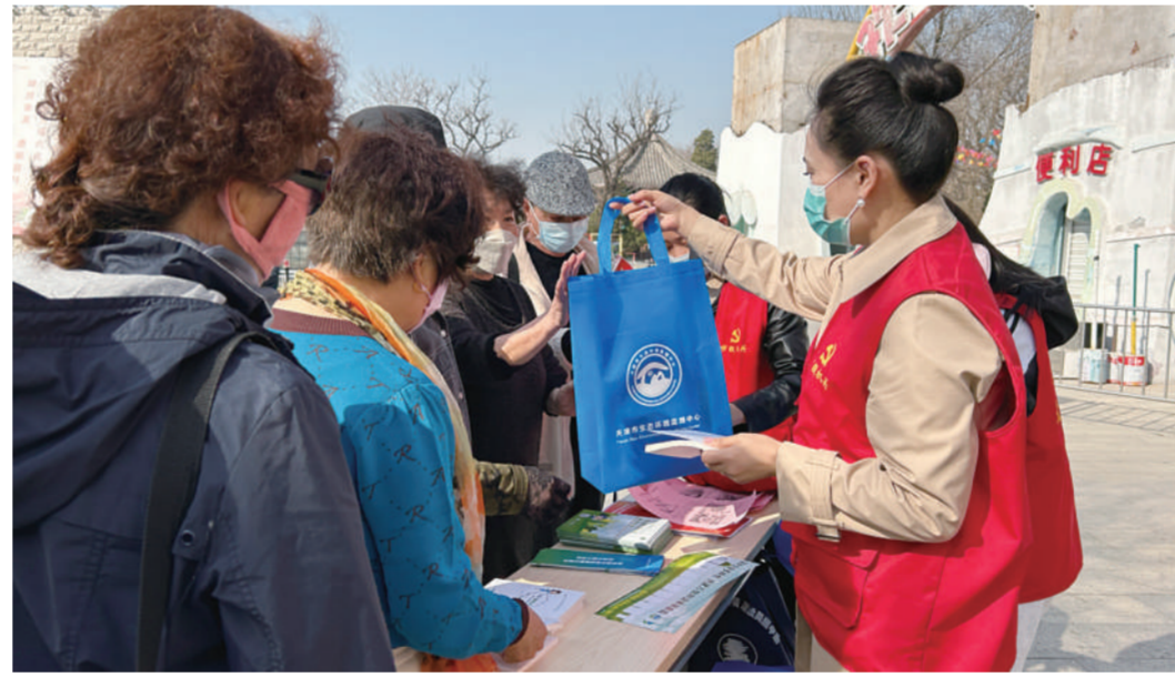
植树节前夕,3月10日,天津市生态环境局在南开区水上公园组织开展了“植树护绿爱绿,倡导文明新风”志愿服务活动,来自局机关和直属单位的50余名志愿者参加了此次活动。图为志愿者向游园群众发放倡导绿色低碳生活宣传品。