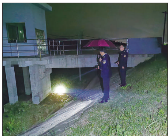
图为执法人员夜间巡查崇仁河防洪堤。

“这次暴雨来得太快,而且非常猛,有很多农田、农房都被水淹了。我们全体干部职工工服从统一调度,按照分组要求,全面排查隐患、全面巡查重点部位、全面整治环境问题,逐项抓好落实,严守不发生环境事件的底线,确保全县生态环境安全。”抚州市崇仁生态环境局局长刘彬说。 截至目前,崇仁生态环境局出动执法检查巡查人员80余人(次),检查企业26家(次),排查并及时整治环境风险隐患8处,有效保障了特大暴雨期间生态环境安全。