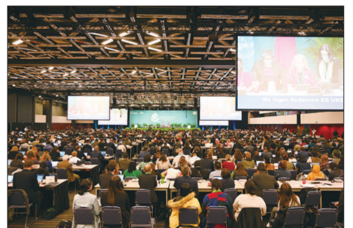
《生物多样性公约》第十五次缔约方大会(COP15)第二阶段会议2022年12月19日凌晨通过“昆明—蒙特利尔全球生物多样性框架”,为今后乃至更长一段时期的全球生物多样性治理擘画新蓝图。