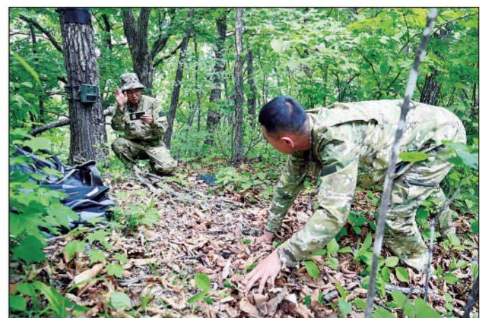
东北虎豹国家公园管理局建设了覆盖近万平方公里的天地空一体化监测体系,实现对野生东北虎豹及其栖息地实时监测,为保护巡护提供了大数据支撑。