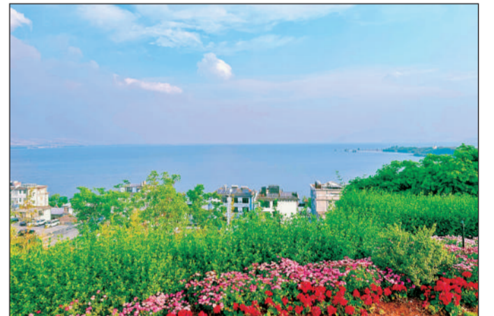
云南省大理白族自治州近年来统筹推进苍山洱海一体化保护,促进人与自然和谐共生,洱海水质连续3年评价为“优”。