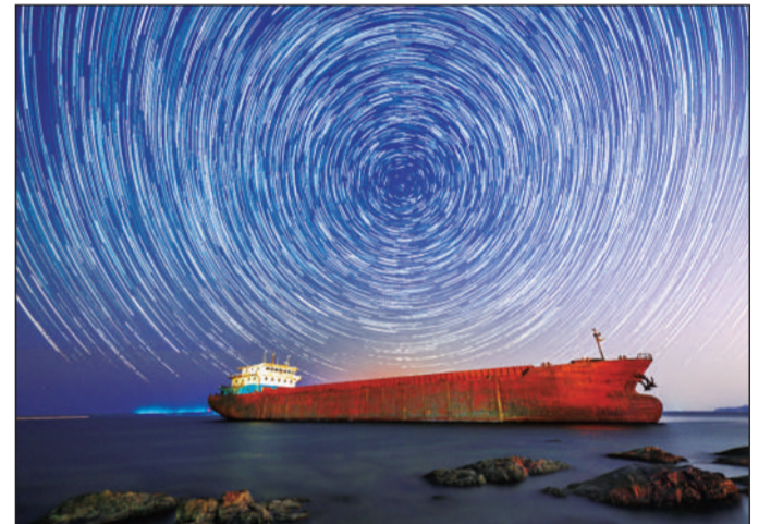
大连旅顺小黑石星轨。