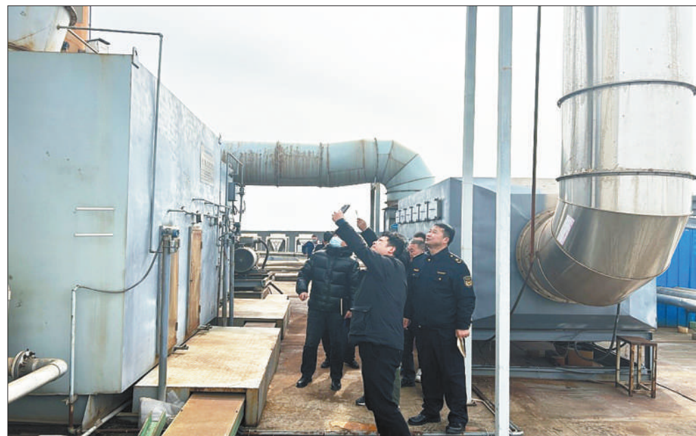
安徽省庐江生态环境分局近日邀请省安全、环保专家对全县66家重点工业企业以及生态环境执法人员开展专题培训,发放企业环境管理知识“应知应会手册”,明确告知企业履行环评手续、排污许可证申领、竣工验收、证后管理以及其他环境管理各项制度和要求。图为专家在企业现场作示范检查。

2023年以来,内黄分局按照市委、市政府全力“拼经济”十大攻坚战要求,立足本职工作,全力优化全县营商环境,处