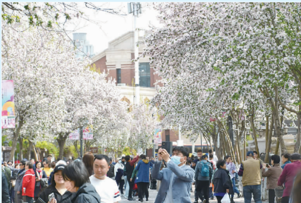
图为和平区五大道海棠花开吸引众多游人前来赏花。

海棠花不仅带来了春日美景,也催热了天津的春日经济。不仅是和平区,这个春天里,天津文旅热度持续攀升,市场火爆异常。根据联通大数据,仅清明假期3天内,天津市共接待游客710.21万人(次),单日游客接待量屡创今年新高。其中,天津本市游客300.75万人(次),外埠游客409.46万人(次)。全市实现旅游收入60.63亿元。任效良 邢语轩