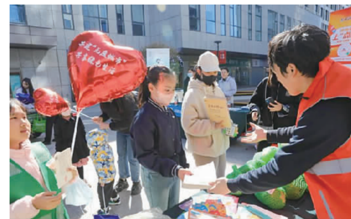
图为“无废南开”创建科普活动现场。