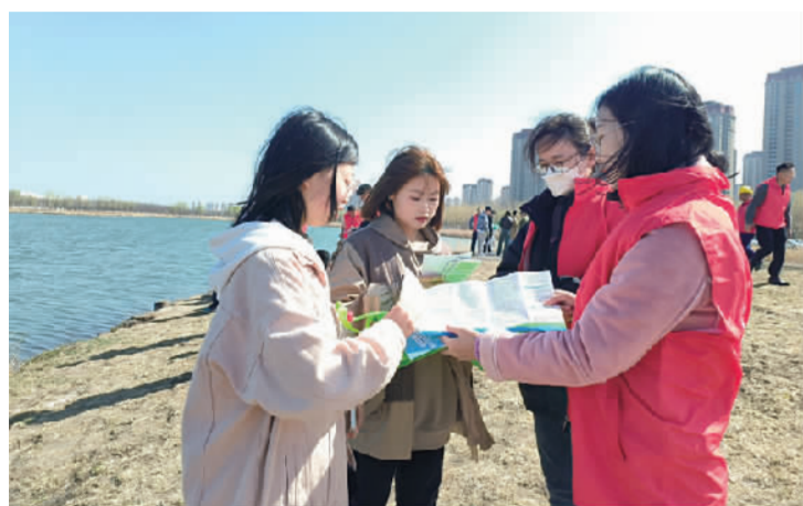
图为津南区生态环境志愿者发放普法宣传资料。