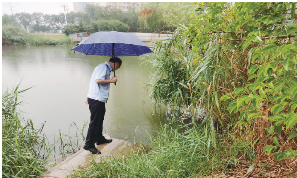
为保障汛期河流水环境质量,山东省济宁市金乡县近期全面开展汛期河湖水质超标隐患排查暨面源污染防治行动,严防生活污水随雨水溢流至河道,确保河流断面水质稳定达标。图为执法人员冒雨查看入河口。